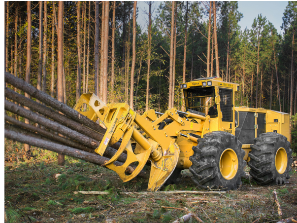
Een 724G veller-stapelaar

De taster maakt gebruik van Renishaw RENGAGE™ technologie (een combinatie van beproefde drukmeting en ultracompacte elektronica) en geeft ook met lange en speciale styli zeer nauwkeurige metingen, wat ideaal is voor toepassingen bij Tigercat waarbij vaak metingen op moeilijk bereikbare plaatsen nodig zijn.