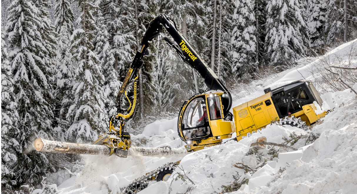
Een 1185 rooier

De dagelijkse onderdelenproductie is ook consistent geworden en het is nu mogelijk geworden om operators bij meerdere bewerkingscentra actief te laten zijn, al naargelang de productie daarom vraagt. Het risico van menselijke fouten is nagenoeg verdwenen en de operator werkt veiliger doordat geen handmatige tussenkomst meer nodig is.