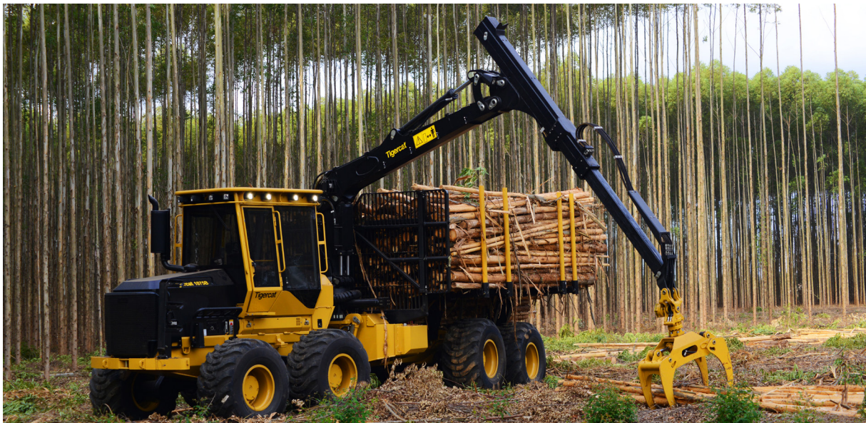
Een 1075 uitrijwagen